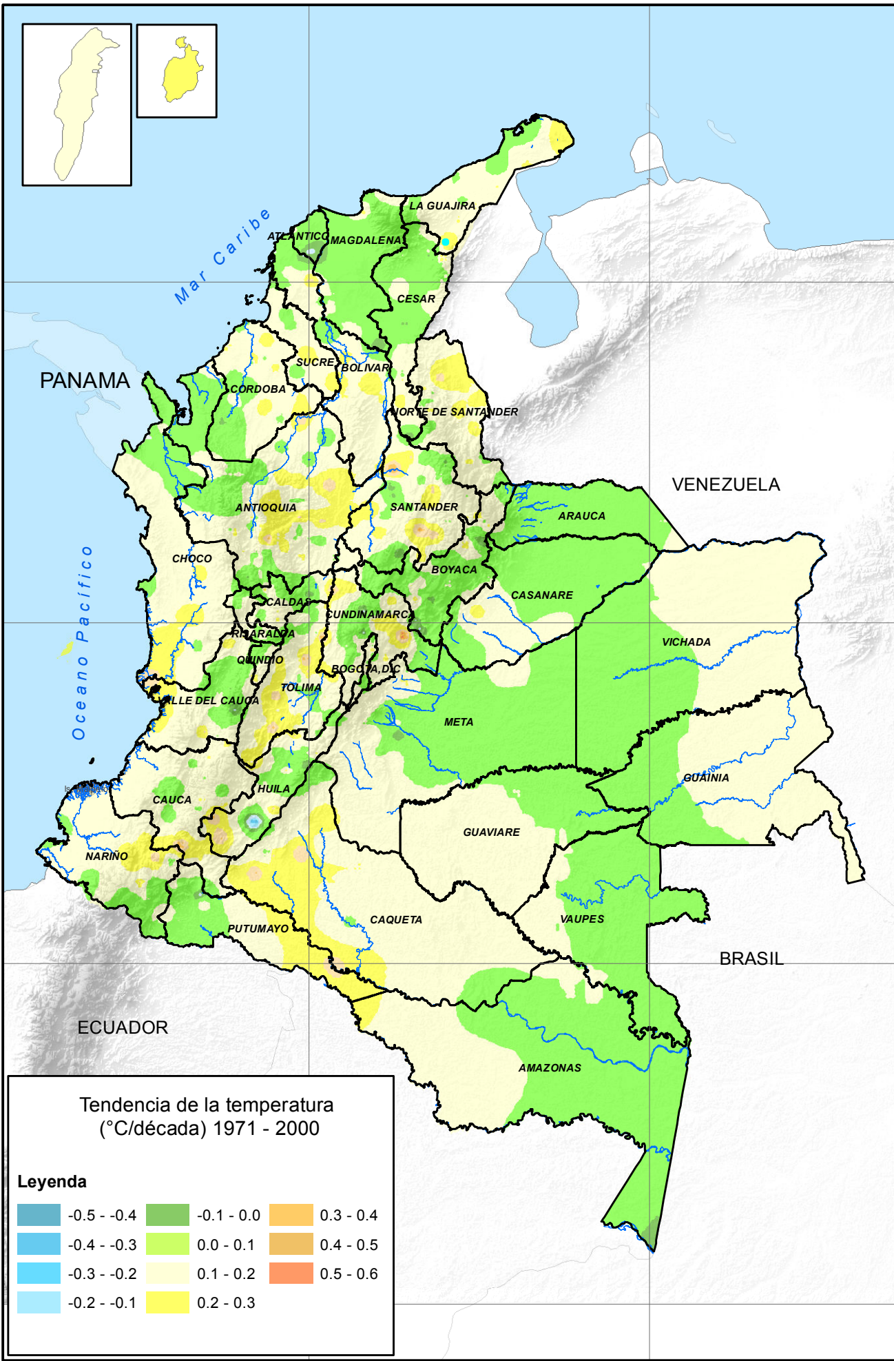
Tendencia de la temperatura (°C/década) 1971 - 2000

Elaborado por: Subdirección de Ecosistemas y SIA © Prohibida la Reproducción total o parcial sin autorización expresa de Ideam